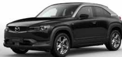
JET BLACK 2-tone (49P)**