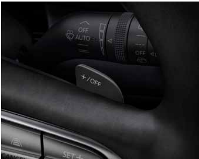
Schakelpeddels achter het stuurwiel voor instelling regeneratief remmen