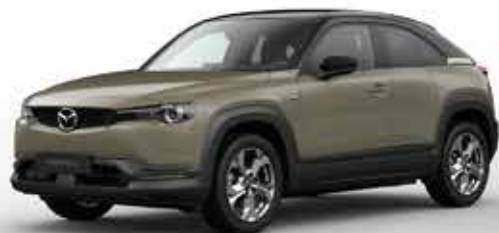
ZIRCON SAND 2-tone (49T)**