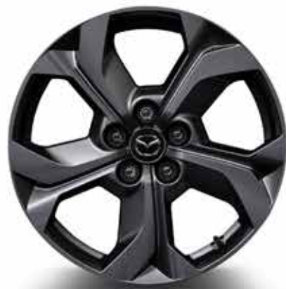
18" 'Bright' lichtmetalen velgen met 215/55 R18 banden (MAKOTO)