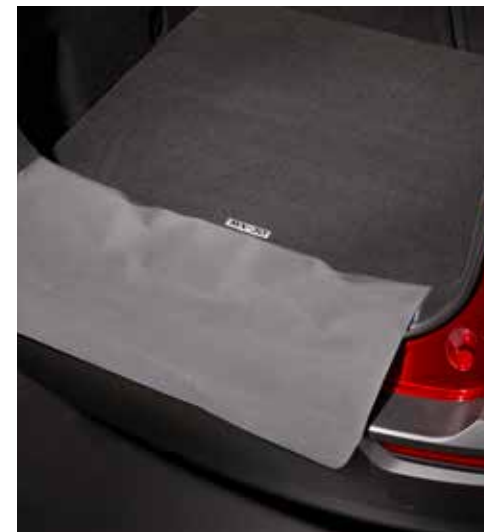
Koffermat met achterbumperbescherming