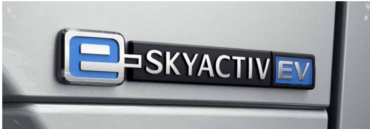
Mazda MX-30 e-SKYACTIV 145 pk