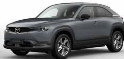
POLYMETAL GREY (47C)*