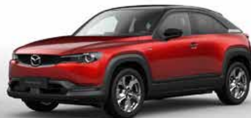
SOUL RED CRYSTAL 2-tone (49V)**