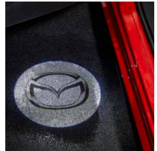
Mazda LED Logo Projector