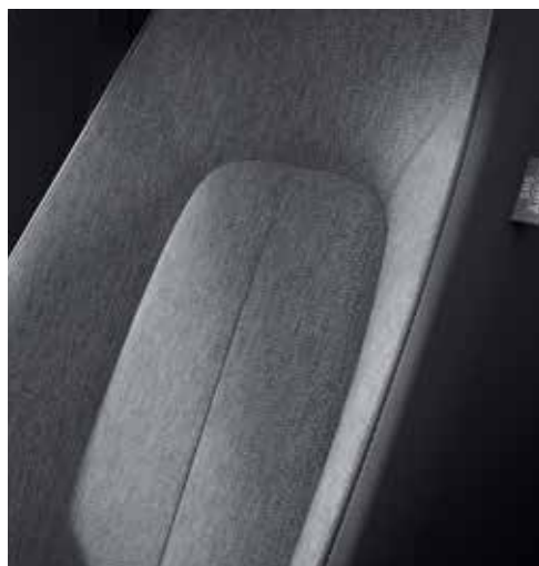
Interieurthema 'Standaard' (PRIME-LINE & EXCLUSIVE-LINE)