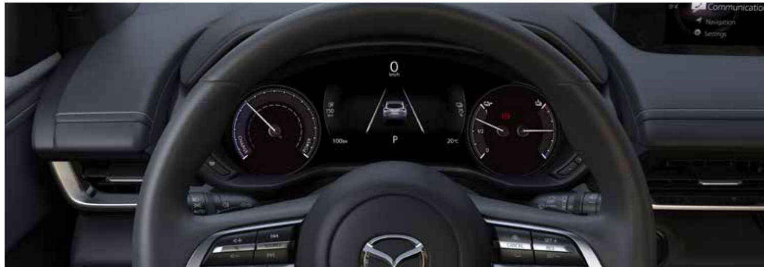
Tellers met 7" TFT kleurenscherm