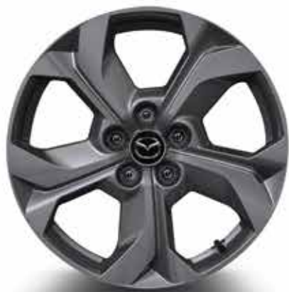
18" 'Silver' lichtmetalen velgen met 215/55 R18 banden (PRIME-LINE & EXCLUSIVE-LINE)