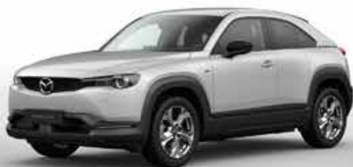
CERAMIC WHITE (47A)*