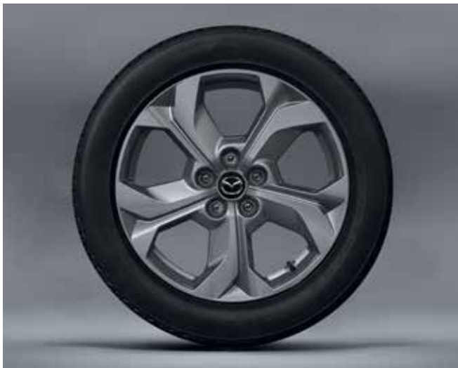
18" 'Silver' lichtmetalen velgen met 215/55 R18 banden