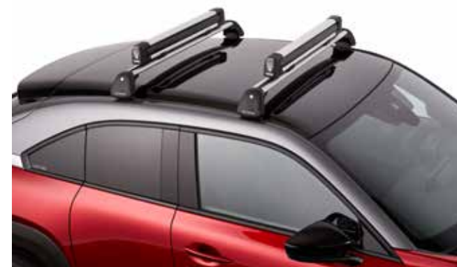
Ski -en snowboarddrager (lang)