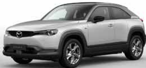
CERAMIC WHITE 3-tone (48A)**