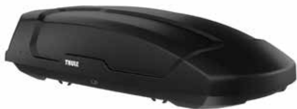
Dakkoffer (Thule Force XT L)