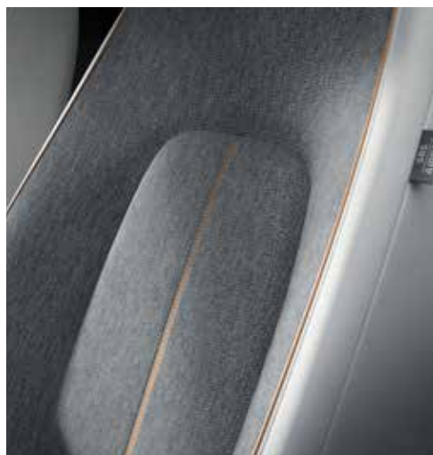
Interieurthema 'Modern Confidence' (Keuze op MAKOTO)