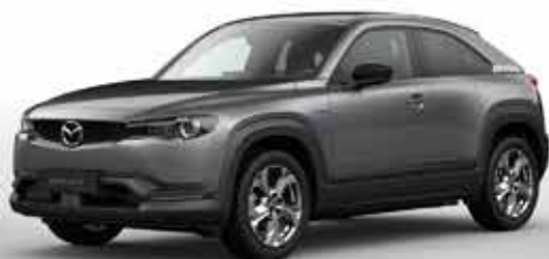
MACHINE GREY (46G)*