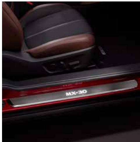
Drempelbeschermers verlicht MX-30 logo